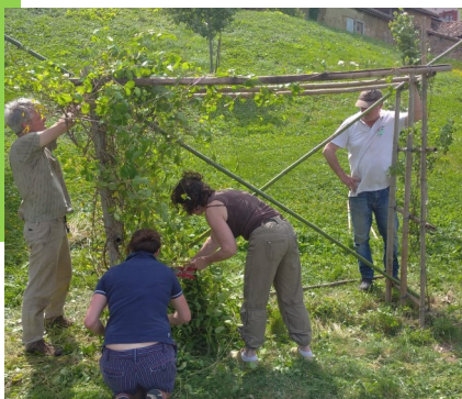
Une dernière touche au chevrefeuille