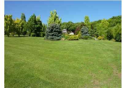
Pelouse bien tondue, dite « propre » pour certains, mais pauvre

Toute zone où pousse l'herbe librement, est un milieu riche, comptant un grand nombre de végétaux différents (et même des végétaux rares), qui va attirer de nombreux insectes, dont les précieux auxiliaires du jardinier, pollinisateurs et prédateurs de parasites.