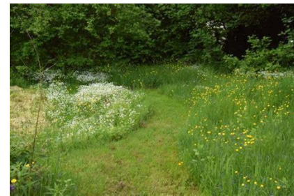
Tonte raisonnée riche en insectes pollinisateurs, papillons et fleurs sauvages