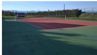
La réfection du terrain de tennis est terminée